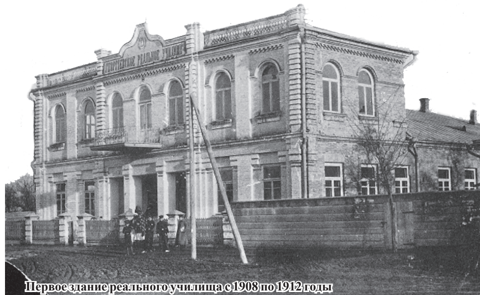
Первое здание реального училища с 1903 по 1912 годы