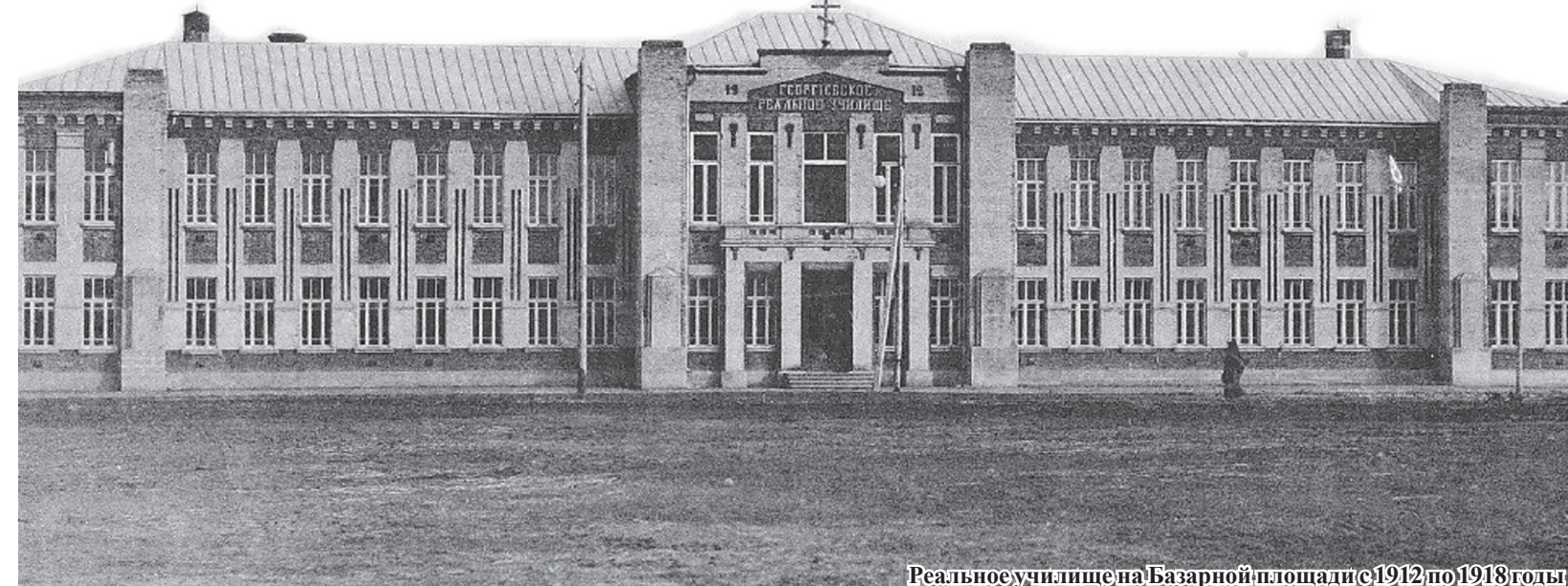
Реальное училище на Базарной площади с 1912 по 1918 годы