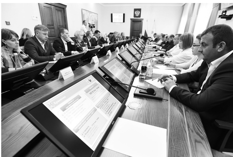
◆ Депутатский контроль

По материалам пресс-службы губернатора и органов исполнительной власти СК.