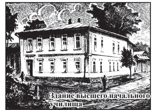
Здание высшего начального училища

одно время, служит упоминание об их деятельности в средствах массовой информации того времени. Например, газета «Пятигорское эхо» в 1914 году писала о широких трещинах в одной из наружных стен женского училища, переведённого в бывшее здание реального училища. Во время летних каникул велись работы по перекладке капитальной стены, в связи с чем, начало занятий нового учебного года было отсрочено до 1 сентября. Известен год постройки здания женской гимназии - 1912. Возможно, что здание это сразу было построено двухэтажным. В то